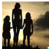
Живет такая девушка. Двухметровая... (фото)