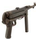
Развенчан МИФ об оружии вермахта