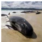
Разгадка найдена! Вот почему киты и дельфины кончатся с собой