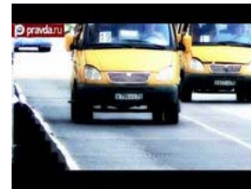
"Лежачий полицейский" 3D