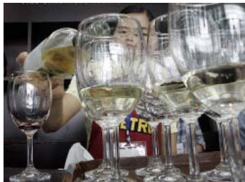
Росалкоголь перекраивает рынок

Федеральная антимонопольная служба считает, что Росалкогольрегулирование (РАР) нарушил закон о защите конкуренции. Как подсчитали в службе, действия регулятора алкогольного рынка привели к сокращению числа производителей и дистрибуторов алкоголя в два раза. Это уже не первый случай, когда ФАС обвиняет РАР в чистках на алкогольном рынке.