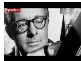
Скончался американский писатель Рэй Брэдбери