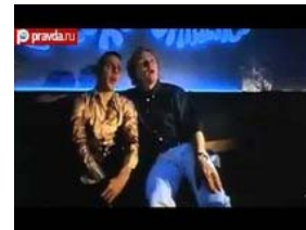
"На игле" признали лучшим