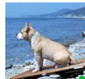
Это ВПЕЧАТЛЯЕТ: собака искусала акулу! (видео)